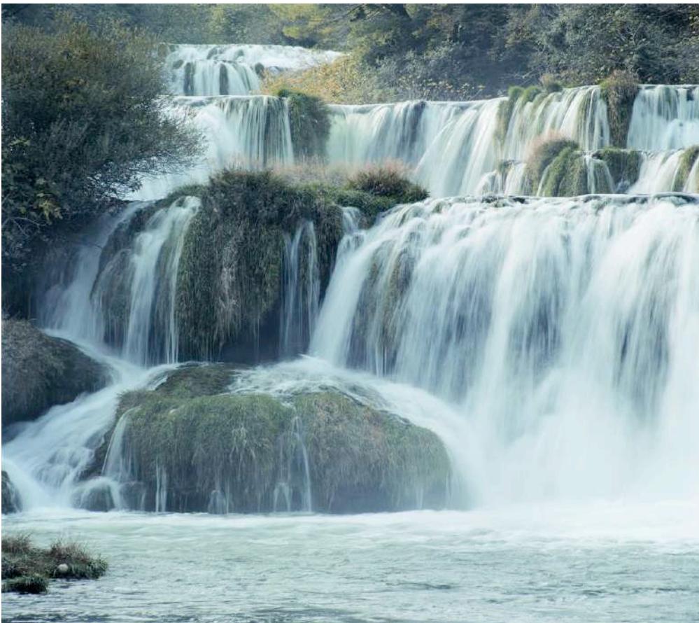
3) Скрадин – Муртер (24 м.м.)